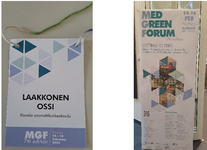
Kuva 3. MedGreen Forum 2024.

MedGreen Forum -konferenssin esityksissä oli myös muita rajapintoja Digital Decathlonin teemoihin. Keskeistä tapahtumassa oli ilmastonmuutokseen sopeutuminen ja ennaltaehkäisy rakennetun ympäristön näkökulmasta. Esityksissä pohdittiin muun muassa sitä millainen rooli arkkitehtuurilla ja energiaratkaisuilla on hiilineutraaliuden saavuttamisessa.