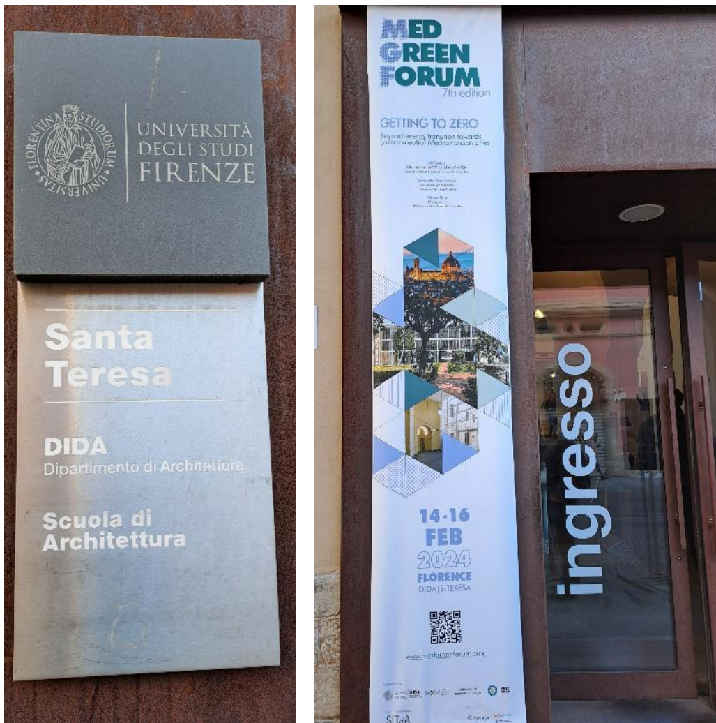
Kuva 2. Firenzeen yliopisto.