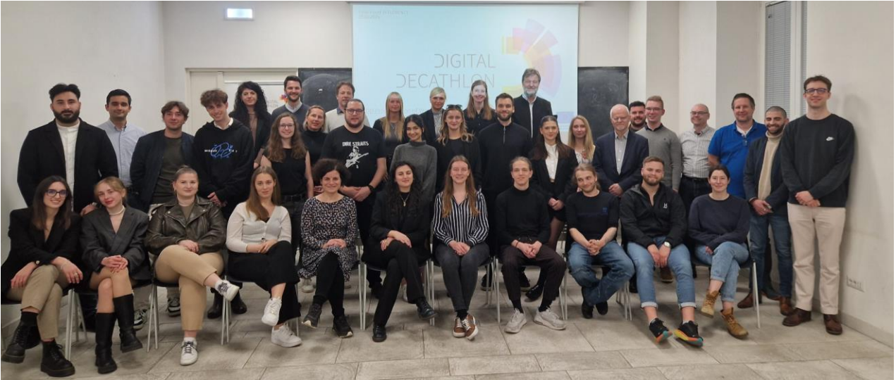
Kuva 1. Digital Decathlon kilpailijat ja valmentajat.

päähän Firenzen yliopiston tiloihin ja koko porukka oli muutaman kuukauden tauon jälkeen taas yhdessä (Kuva 1).