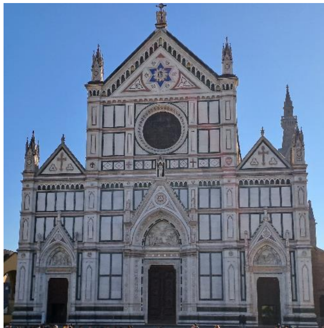
Kuva 4. Nähtävyyksiä ja pientä purtavaa.

Torstain ohjelmassa oli kilpailun huipennus, eli tiimien töiden esittely, arviointi, voittajien julkistus ja palkitseminen. Kaiken kaikkiaan ensimmäisessä kilpailussa oli mukana viisi joukkuetta, joissa jokaisessa oli viisi opiskelijaa