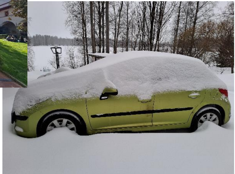
Kuva 7. Helmikuu Firenzessa ja Joensuussa.

Digital Decathlon -kilpailu jatkuu vuoden 2024 syksyllä uudella aiheella uusien opiskelijoiden voimin. Toisessa toteutuksessa tavoitteena on innostaa mukaan