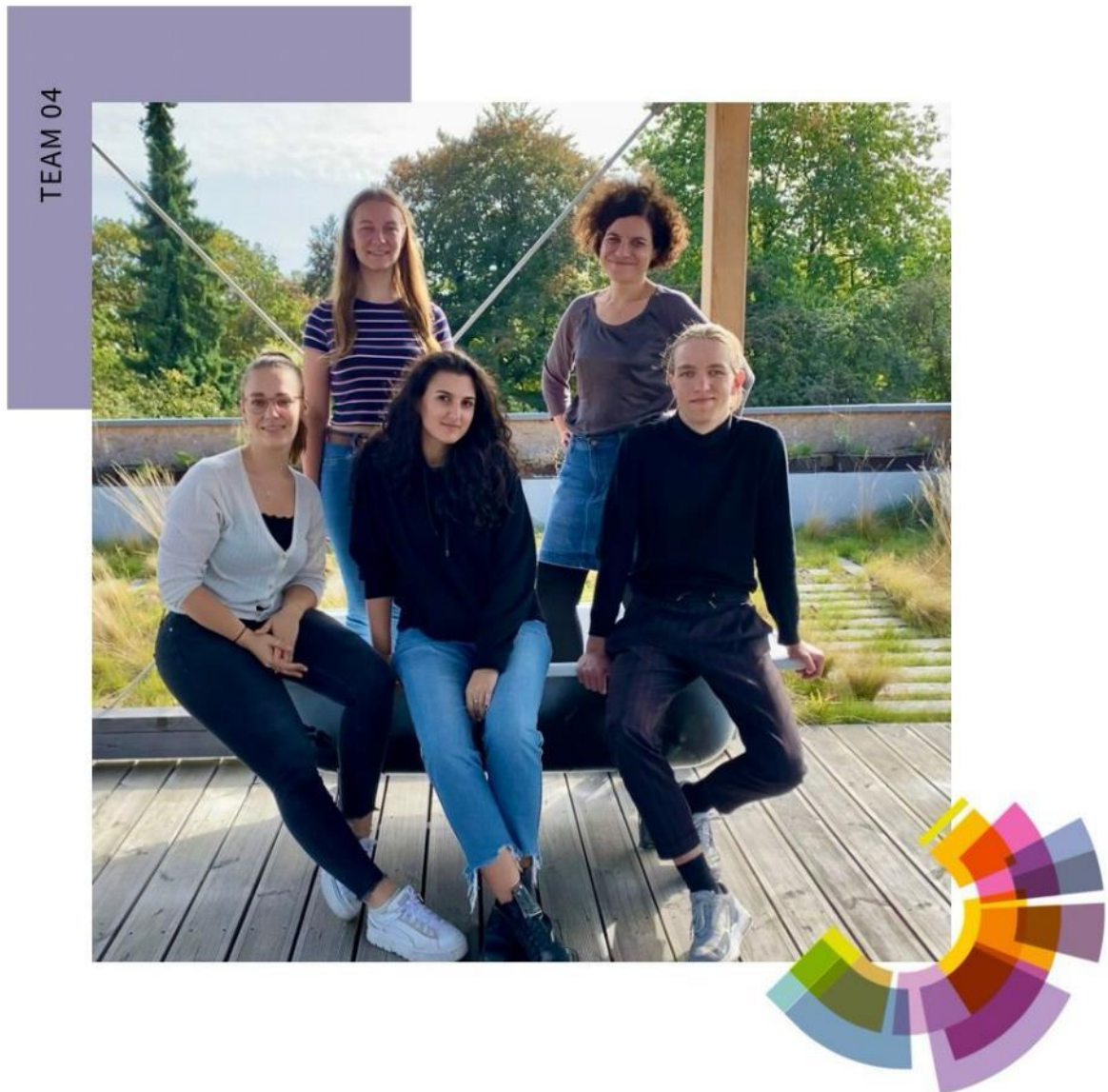
Kuva 6. Voittajatiimi.

Palkitsemisen jälkeen olikin aika siirtyä läheiseen ravintolaan ja juhlistaa kilpailun loppua spritzien äärellä. Raikkaan juoman ja iloisen keskustelun jälkeen siirryimme firenzelaisten järjestäjien jäljessä tyypilliseen paikalliseen pitsaravintolaan maistamaan ”oikeaa” pitsaa. Miljöö ja ruoka olivat aivan erinomaisia, seurasta nyt puhumattakaan. Aivan ongelmitta kommunikaatio ei